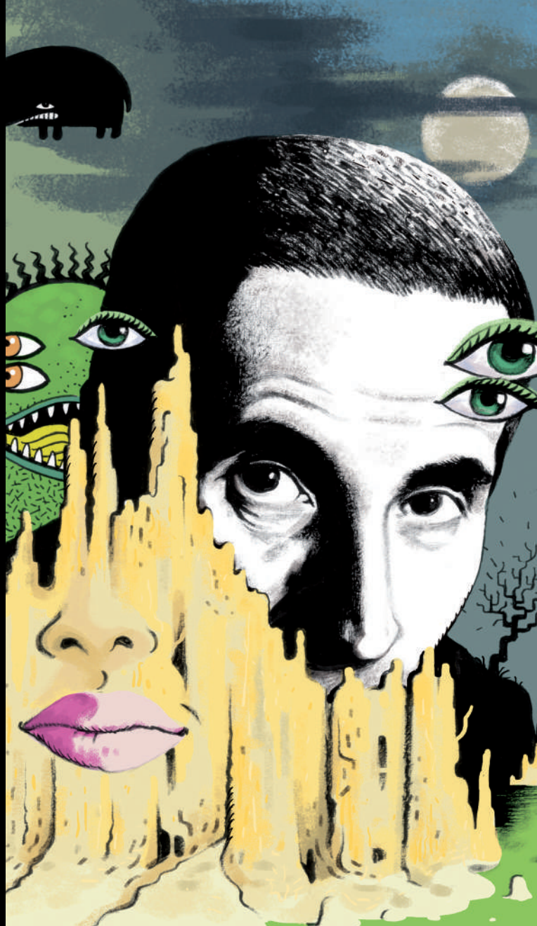
illustrazione di copertina: Sergio Ponchione